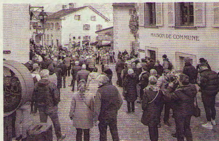
Foule des grands jours lors du vernissage en novembre. JOSÉ FANGUEIRO